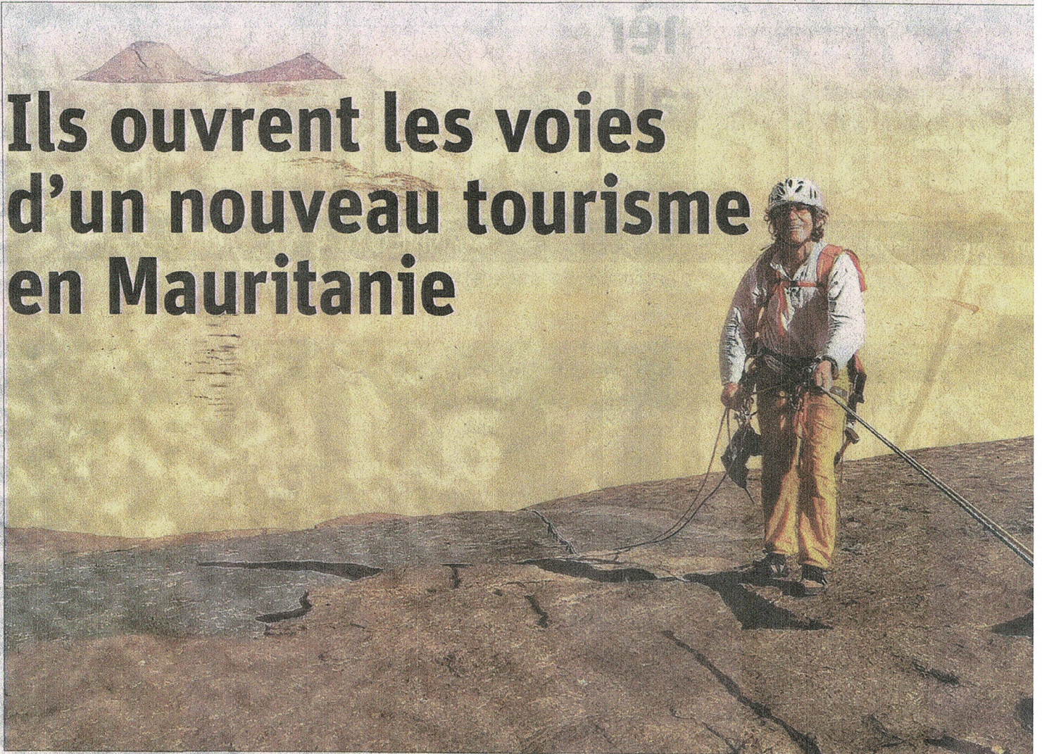
Perdus dans l'immensité sablonneuse, ces monolithes devant lesquels seuls quelques Touaregs passaient ont capté l'attention des grimpeurs français. Photo

Un guide de Saint-Gervais a accompagné plusieurs Français en Mauritanie pour ouvrir et équiper des voies d'escalade dans des monolithes monumentaux jamais grimpés. Encouragés par les autorités locales, ils veulent relancer le tourisme de ce pays délaissé.